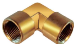
Cotovelo Fêmea 90° – AZ 507-A