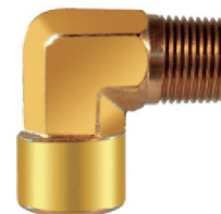
Cotovelo M/F 90° – AZ 508-A