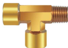
Tee Macho Lateral – AZ 511-A