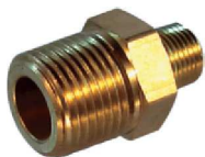
Niple Redutor – AZ 503-A