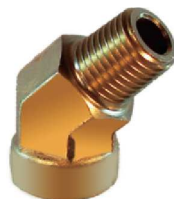
Cotovelo M/F 45° – AZ 509-A