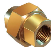
União Desmontável – AZ 515-A