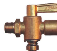
Torneira Ar Scania Original AZ 526-A