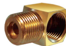
Cotovelo Curto M/F 90° – AZ 506-A