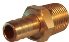
Bico de Mangueira – AZ 518-A