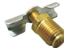
Torneira Dreno – AZ 525-A