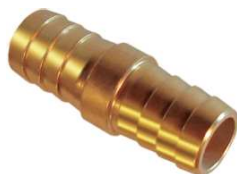
Emenda de Mangueira – AZ 520-A