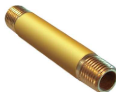
Niple Longo – AZ 514-A