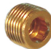
Bujão Sext. Interno – AZ 531-A