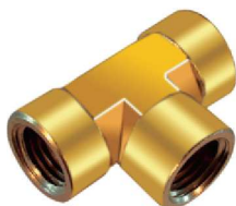
Tee Fêmea – AZ 510-A