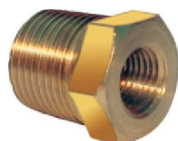
Buchta de Redução – AZ 513-A