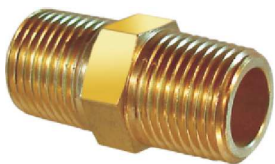
Niple Reto – AZ 504-A