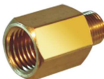
União M/F – AZ 505-A