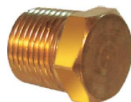
Bujão Sextavado – AZ 522-A