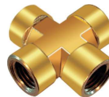
Cruzeta Fêmea – AZ 512-A